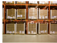
Almacenaje 90% agua