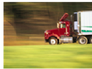
Transportación 90% agua