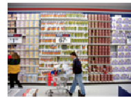
Frentes en punto de venta